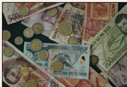
La Comisión logró el pago de la póliza

Luego de que el padre del joven fallecido presentó su queja, la Comisión Estatal de Derechos Humanos realizó la investigación y trámite correspondientes. Como resultado del proceso, la CEDHJ logró que el padre recibiera la póliza de seguro por la cantidad pactada.