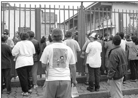
Los padres se quejaron del cobro indebido de material

Servidores públicos de la Secretaría de Educación Jalisco (SEJ) tendrán que devolver 311 mil 530 pesos a los padres de estudiantes a los que se les cobraba de forma indebida por concepto de material utilizado cada vez