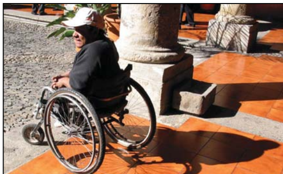
Las personas con capacidades diferentes serían beneficiadas

De igual manera, se orientó a los quejosos para que, si es de su interés, con base en el artículo 94 de la Constitución Política del Estado, interpongan una queja ante la comisión de responsabilidades del Congreso en contra de los diputados de la anterior legislatura que, consideraran, no cumplieron con su responsabilidad.