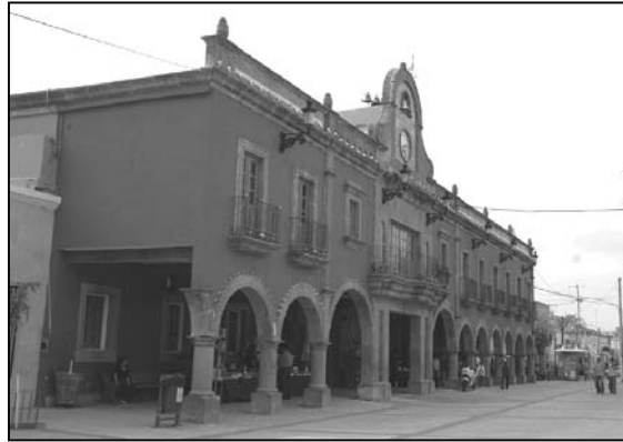
El alcalde ordenará la atención inmediata de los reportes