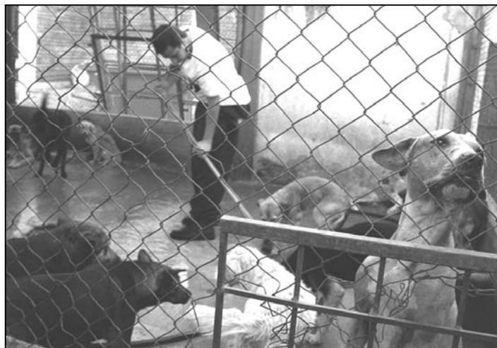
Una tercera parte de los perros callejeros fue abandonada por sus dueños

Si no vive en Zapopan, no se haga ilusiones. Por lo menos en las páginas de Internet de los demás municipios es imposible encontrar el número telefónico de un centro antirrábico, de sanidad animal o control canino. Y cuando uno solicita el servicio en el conmutador de la presidencia, los que atienden