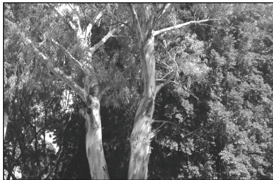
Se propuso declarar el bosque área natural protegida

La queja que motivó esta conciliación fue interpuesta el 28 de octubre de 2005 por el Comité Promotor Salva Bosque Tigre II, debido a que personal del Ayuntamiento de Zapopan tenía la intención de llevar a cabo una serie de proyectos urbanos que atentaban contra la vida del Nixticuil, pues su ejecución ocasionaría la pérdida irreparable