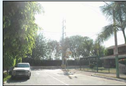
Los vecinos acudieron a la Comisión

Con el fin de evitar la posible consumación irreparable de violaciones de derechos humanos de los vecinos de las colonias Jardines del Sol, Ciudad del Sol, Mirador del Sol y de otras aldeñas, la CEDHJ solicitó al alcalde de Zapopan, Juan Sánchez Aldana, la revocación de las licencias o permisos que el ayuntamiento otorgó para la construcción del proyecto La Ciudadela, o suspender o clausurar la construcción de dicho inmueble.