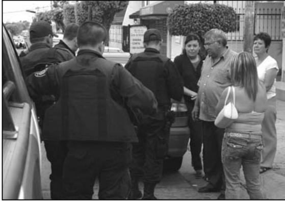
La CEDHJ insiste en que los retenes violan la Constitución

Esta conciliación fue propuesta luego de que la Comisión recibió una llamada telefónica, la cual refirió que en la carretera Guadalajara-Salttillo, cerca del balneario Los Camachos, se encontraba establecido de manera permanente un retén. La persona manifestó que en dos ocasiones en un mismo día fue re-