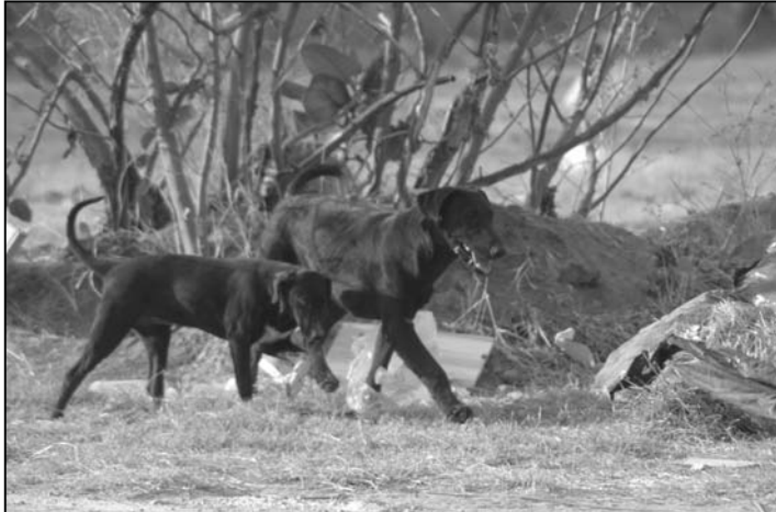
En 2006, en Guadalajara se reportaron 470 mordeduras de perro