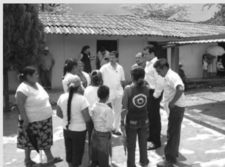
En la gira evaluaron las condiciones de los nahuas

Destacó la importancia de la construcción de un puente para cruzar el río Marabasco, lo que hace la diferencia entre la vida y la muerte, ya que ahí mueren personas por no poder cruzar y porque no alcanzan a recibir atención médica.