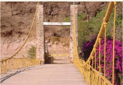
Se investiga la legalidad de los actos

Entre los pendientes por resolver está, además, que la zona de la barranca Huentitán-Oblatos ha sido designada zona de protección forestal, área natural protegida con carácter de zona sujeta a conservación ecológica y zona de protección hidrológica municipal.