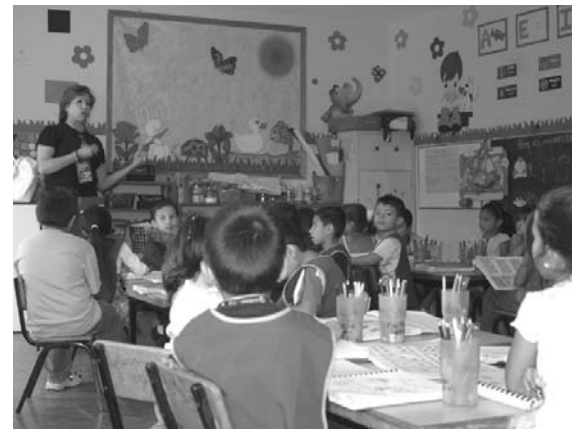
Buscan condiciones que favorezcan su aprendizaje

Por intervención de la Comisión Estatal de Derechos Humanos, el Ayuntamiento de El Salto reconoció la problemática que enfrentaban los alumnos de un jardín de niños que recibían clases en una bodega, la cual no reñía las condiciones mínimas para una estancia digna.