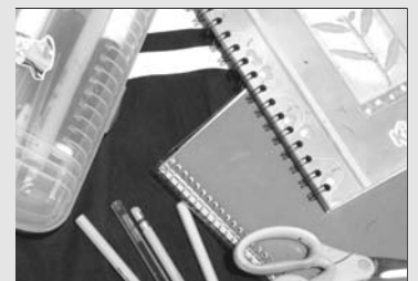
Los útiles eran vendidos en el plantel

Además, la Comisión pidió al director de nivel una supervisión estrecha, y que