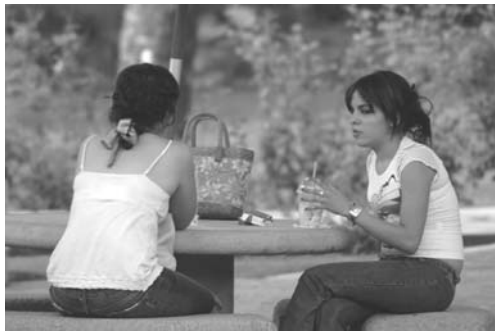
La educación sexual es un derecho fundamental

En entrevista, el ombudsman explicó que con respecto a la declaración del gobernador del Estado Emilio González Márquez, en el sentido de que los preservativos serían distribuidos únicamente a la población homosexual, este organismo no puede emitir pronunciamiento alguno mientras no existan acciones u omisiones que vulneren los derechos fundamentales es decir, en caso de que este señalamiento se concrete. "Esperemos que exista de parte del señor gobernador alguna reconsideración al respecto; si no, en su momento estaría la Comisión valorando alguna otra actuación".