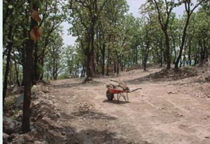
La licencia es de la administración anterior

La insistencia de la Comisión es con el fin de evitar la consumación irreparable de violaciones de derechos ambientales.