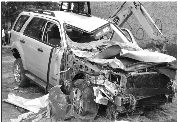
Así quedó la camioneta que fue arrastrada por la corriente

Alguien dijo una vez que la zona metropolitana de Guadalajara es como un Alka Seltzer: "con agua se deshace". Y aunque esta analogía parece cumplirse cada temporal con los daños que provocan las lluvias, con la destrucción de casas, calles y automóviles, 2007 se ha tenido de rojo como nunca en los últimos años, con la muerte de más de una decena de personas a causa del temporal en la zona metropolitana y en otros municipios del estado.