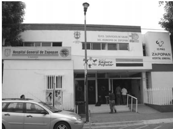
La negligencia médica provocó la muerte de un menor

Además, la PGJE instruyó al agente del ministerio público adscrito al Juzgado de lo Criminal para que vigile el periodo de instrucción de la causa criminal iniciada por estos hechos y, formule, de así proceder, las conclusiones acusatorias correspondientes.