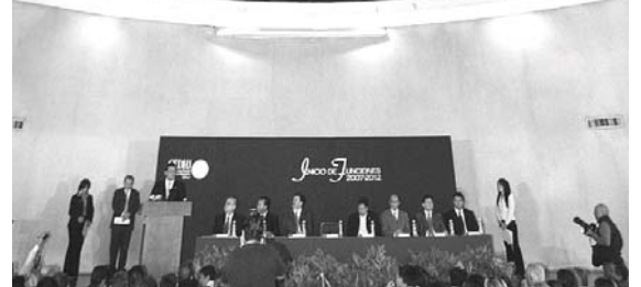
El ombudsman aseguró que actuará con autonomía