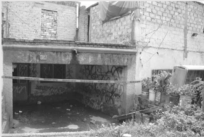
La colonia San José del Quince, de las más afectadas

3. Los estados deben adoptar medidas para eliminar los obstáculos al desarrollo, resultantes del incumplimiento de los derechos mencionados.