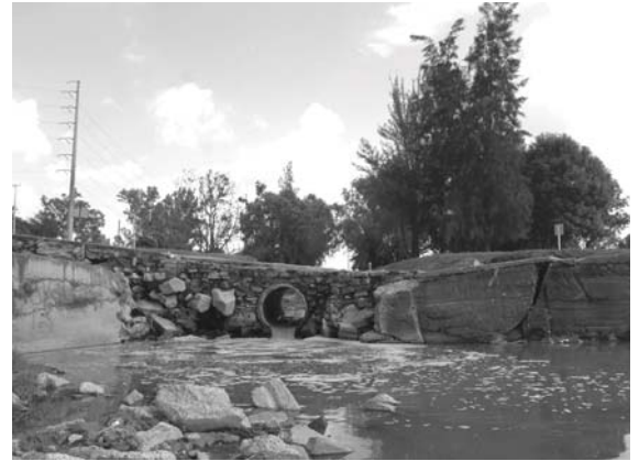
Las autoridades omitieron instalar protecciones al puente