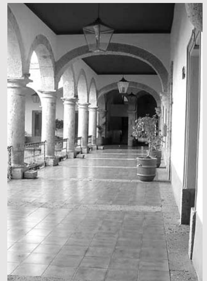
Los visitantes sólo tienen que registrarse

A raíz de esta situación, el titular de la CEDHJ informó que se inició el acta de investigación 138/07 para indagar la certeza de esta disposición y si con ésta se violan los derechos humanos de los habitantes de Jalisco; sin embargo, con la respuesta del diputado, el acta fue archivada.