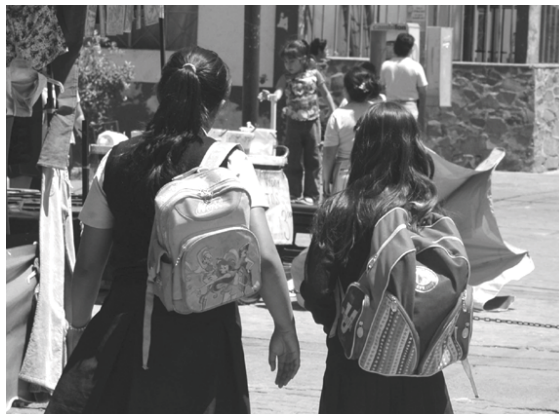
Por ahora no hay peticiones de la operación

Sobre las revisiones a las mochilas de los alumnos, el titular de la SEJ fue puntual y señaló que si los padres de familia llegan a pedir eventualmente algo, tienen que ser los padres de familia quienes hagan este tipo de cosas, "pero nadie tiene que pasar por encima de los derechos de los niños".