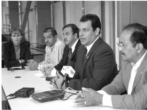
Álvarez pidió la capacitación de los policías

•Presenta informe especial sobre actuación de policías municipales