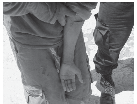
Un interno se lesionó a sí mismo

espacios que antes estaban destinados a adultos. Como ejemplo, en Ocotlán se observó que los internos duermen en una banca de hierro, sin colchón, ubicada en el espacio para descanso de los policías municipales; en caso de que exista más de un adolescente, son trasladados a una celda para adultos, la cual se encuentra en condiciones deplorables.