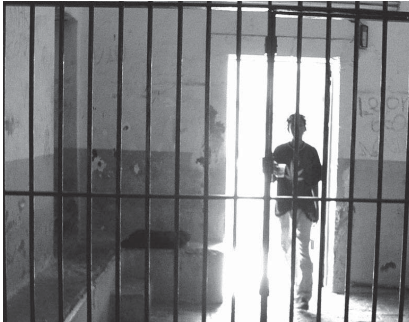
Se pide garantizar la estancia digna

Álvarez Cibrián señaló que los módulos y dormitorios carecen de iluminación y ventilación natural y artificial, sanitarios, regaderas, agua potable, ropa de cama y colchones, así como lugares destinados para ingerir alimentos y para esparcimiento. Los menores de edad no tienen actividades recreativas, educa-