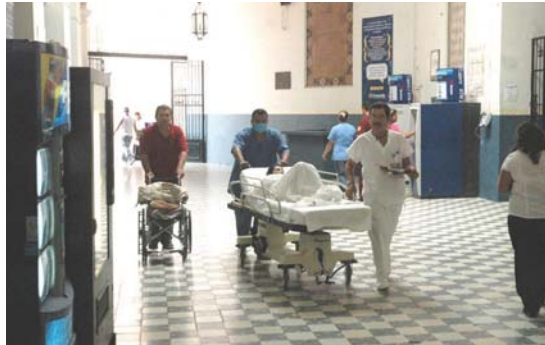
Se garantizó la atención oportuna

Solicitó también que se proporcionara información veraz y oportuna a los pacientes que se encuentran en espera de recibir