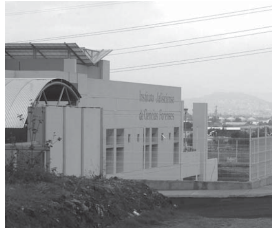
Un perito del IJCF actuó incorrectamente