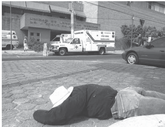
El hombre estuvo tres días en la calle sin atención

Al titular del DIF municipal lo exhortó a intensificar las acciones que realiza la dependencia en la detección y atención de indigentes y elaborar un protocolo que determine el actuar de los servidores públicos del Ayuntamiento que encuentren a una persona en situación de indigencia. También hizo un llamado al director de la Unidad Asistencial para Indigentes, a que se coordine con las autoridades del DIF y realicen acciones tendentes a fortalecer la atención integral de las personas en situación de indigencia.