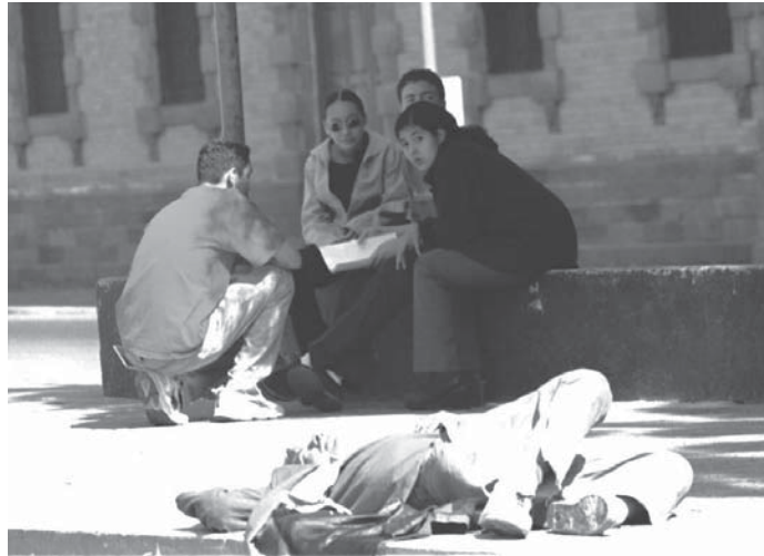
La indiferencia hacia el necesitado es común

El hombre es uno entre los casi seis centenares de indigentes que pululan por las calles de Guadalajara. Los indigentes son una población fluctuante, imposible de censar con precisión; sin embargo, el grupo de investigadoras del Departamento de Trabajo Social del Centro Universitario de Ciencias Sociales y Humanidades (CUCSH) de la Universi-