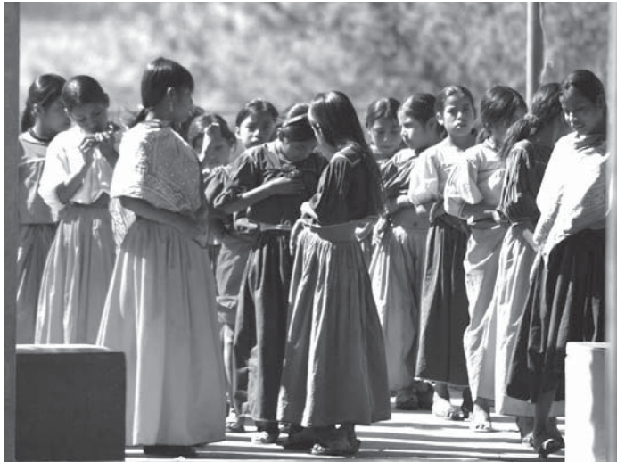
Niñas de la comunidad wixárika