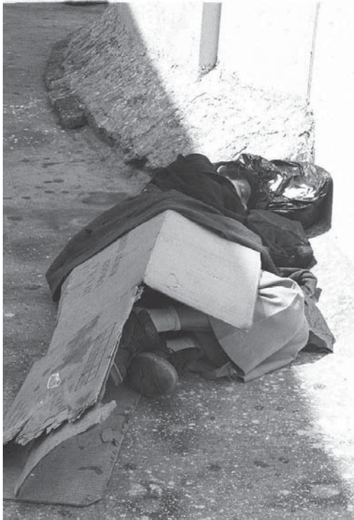
Cuatro de cada diez indigentes viven en la calle

Horas después, el hombre de la calle Corona había desaparecido. Como un fantasma, su figura puede deambular, apare-