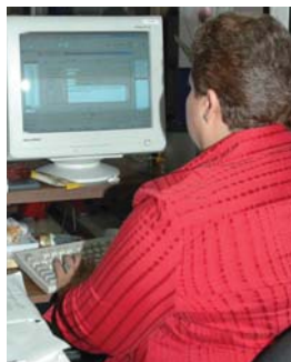
Argumentan carga laboral

Por ello, se inició de oficio la queja 9448/2008, en contra del síndico y el director jurídico, así como de los demás funcionarios que resulten responsables de los hechos violatorios