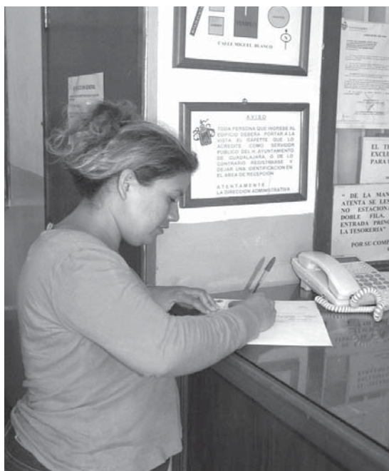
La viuda del agraviado recibió el cheque

cándole la muerte en forma inmediata. Posteriormente, salió del local, pero fue interceptado por elementos tonaltecas, quienes le solicitaron que tirara su arma. Él reaccionó dándose un tiro que le provocó la muerte.