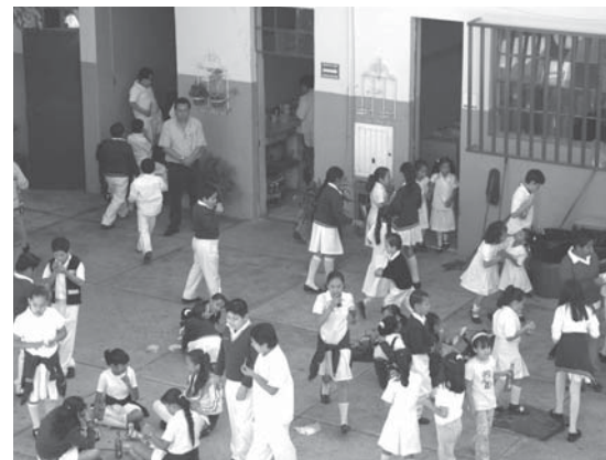
El niño se cayó y golpeó durante el recreo