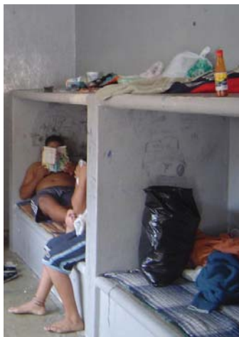
No hay instalaciones adecuadas

Esto, luego de presentar un informe especial donde se acreditó que no reúnen los mínimos requisitos para una estancia digna y segura destinada a lograr su reintegración social; tampoco garantizan el goce de sus derechos. /3