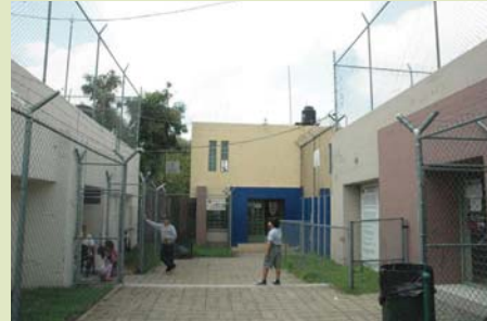
El director del Tutelar investigará los hechos

rector del centro, se le solicitó que lo investigue para determinar si fue omiso al tomar las medidas preventivas para evitar este tipo de sucesos y por entor-