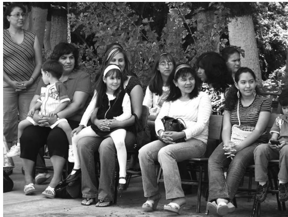
El trabajo doméstico no es reconocido

La maestra Uribe señala que Jalisco tiene una tasa de participación mayor que la nacional. “Se trata del 43.4 por ciento lo que representa una fuerza laboral considerable y que aporta de forma directa al desarrollo social, pero también en lo que implica su otro proceso de trabajo que cuesta ser recono-