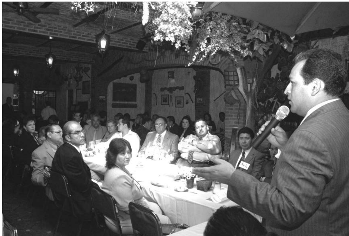
Trabajo intenso y sostenido

ble que impulse ante el cabildo el dictamen de pensión vitalicia; lograr su aprobación sería un acto de auténtica justicia", apuntó.