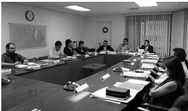
El Consejo generó 133 acuerdos

El Consejo Ciudadano de la Comisión Estatal de Derechos Humanos es un órgano de participación civil integrado por el presidente de la institución, ocho consejeros ciudadanos propietarios e igual número de suplentes. Su integración es plural para lograr la mayor representatividad social posible.