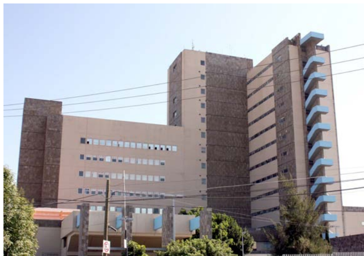
La CEDHJ acreditó dos casos de negligencia

De igual forma, la Secretaría de Seguridad Pública, Prevención y Readaptación Social del Estado, en la Recomendación 20/08, reparó el daño a la familia de un niño fallecido, así como a otras dos personas que resultaron lesionadas por ocho policías estatales. Asimismo, marcando un precedente histórico, ofreció disculpas a los deudos y víctimas de estos hechos.