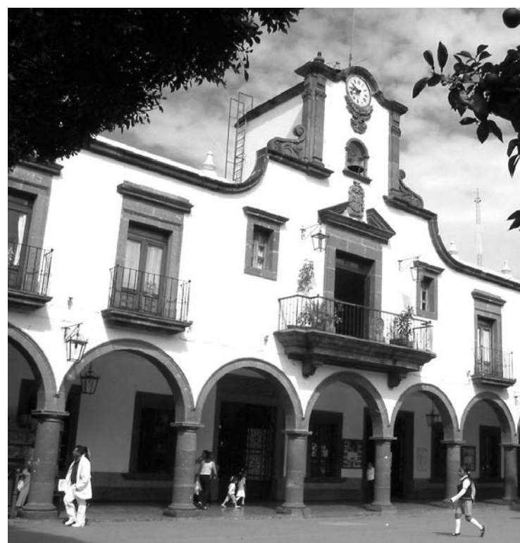
Tlaquepaque, el municipio con más quejas

Una queja puede contener más de un tipo de violación. Una queja puede abarcar a uno o más agraviados.