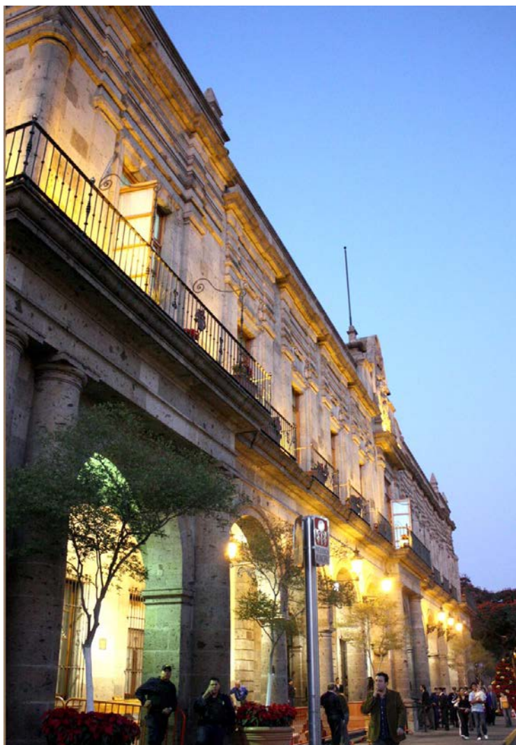
Ayuntamiento de Guadalajara

En julio de 2006, la Comisión inició un acta de investigación a raíz de una nota periódica que informaba sobre la compra de diez pistolas Taser X26 por parte del municipio. En ese entonces se solicitó como medida cautelar la suspensión del posible uso del arma, hasta que se verificaran los daños a la salud que pudieran causar y las repercusiones legales. A pesar de que se aceptó la medida, fue incumplida, ya que una persona recibió, de manera ilegal e innecesaria, dos disparos de pistola eléctrica durante su arresto. Por ello, también se pidió agregar copia de esta resolución al expediente del policía para que quede constancia de que violó derechos humanos.