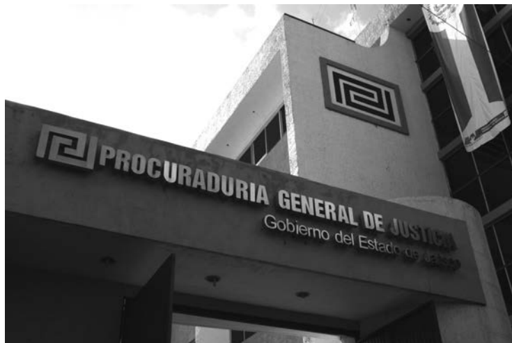
La Comisión pidió a la PGJE agilizar la averiguación

La madre reveló a los medios diversas irregularidades cometidas por el Ministerio Público que integraba la averiguación y que el agresor había ordenado el secuestro de la joven para que se desistiera de la denuncia. Por esto se inició una averiguación, en la que también se mencionó al actual procurador, Tomás Coronado Olmos, supuestamente por haber acudido a una fiesta en enero de 2007, en donde habría sostenido sexo oral con una menor de edad apodada la China.