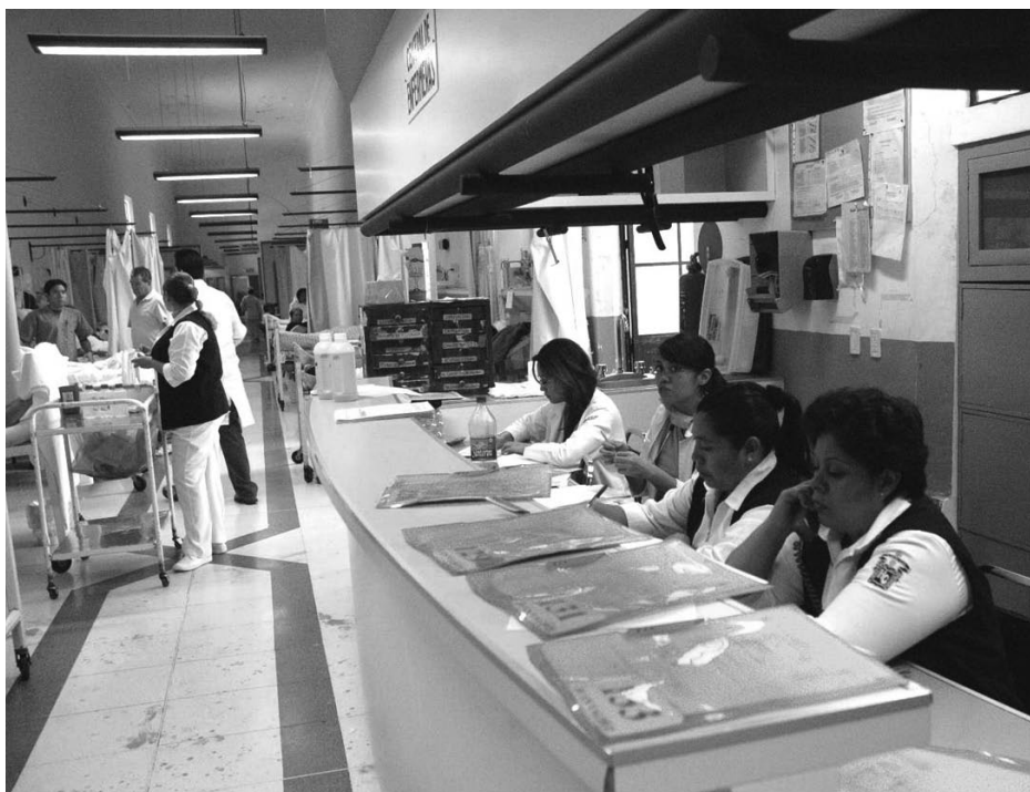
En 30 años se duplicó la participación de la mujer

• El puesto más alto que han alcanzado las mujeres en la Administración Pública Federal ha sido el de secretarías de Estado; el primer caso fue en 1976, cuando Rosa Luz Alegría fue nombrada secretaria de Turismo durante el periodo de 1976 a 1982, en la época del presidente José López Portillo.