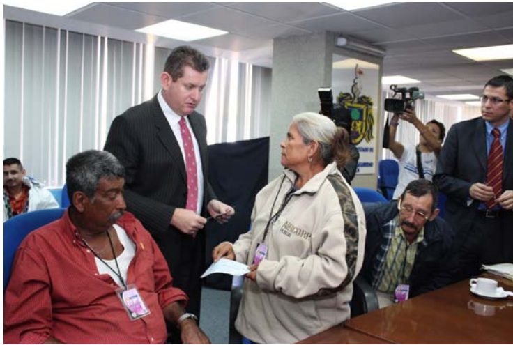
Histórico, la SSP indemnizó a los agraviados

Por su parte, aunque el director general del DIF aceptó analizar la posibilidad de incrementar personal especializado que apoye al Consejo y poner en marcha programas multi-