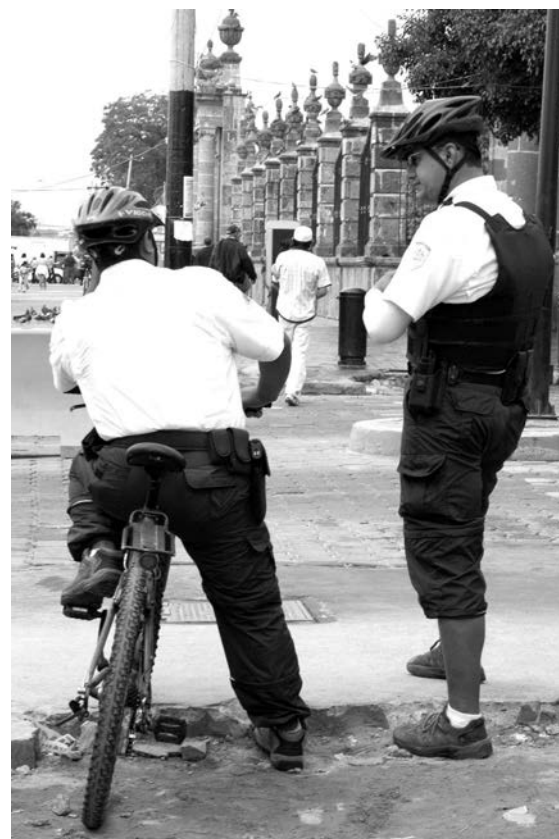
Policías municipales fueron capacitados

En comparación con el año pasado, en 2008 se triplicó el número de actividades de vinculación con organismos públicos y de la sociedad civil, específicamente en las relacionadas con grupos vulnerables. La cifra creció 260 por ciento.