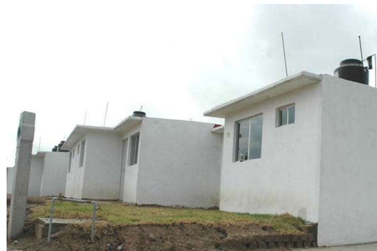
Las casas tienen muchos desperfectos

En lo que respecta a no iniciar las averiguaciones previas