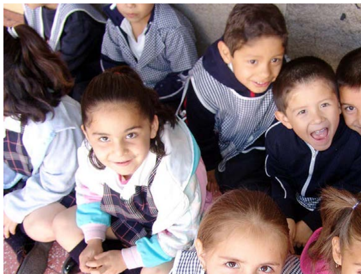
El DIF debe dar seguimiento a custodias

El Ayuntamiento de Ayotlán no ha indemnizado a la familia de un hombre que fue retenido cuatro días en los separos y que murió por no recibir la atención médica adecuada. Esto, como respuesta a la Recomendación en la que también se le pidió al presidente