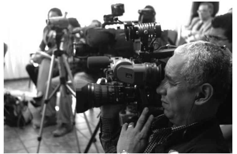
Se efectuaron 42 conferencias de prensa

Con el fin de coadyuvar con las labores de difusión de la cultura de los derechos humanos en Jalisco, esta oficina elabora y publica dos medios impresos;