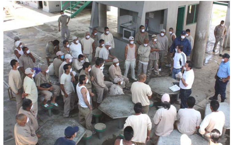
La SSP respondió oportunamente

El secretario de Seguridad Pública del Estado, Luis Carlos Nájera Gutiérrez de Velasco, aceptó las medidas cautelares dictadas por la Comisión Estatal de Derechos Humanos de Jalisco y giró instrucciones para que se continúe proveyendo los implementos necesarios al interior de los reclusorios del estado y así dar cumplimiento a las recomendaciones emitidas por la Secretaría de Salud con el fin de evitar algún posible brote del virus de influenza A H1N1.