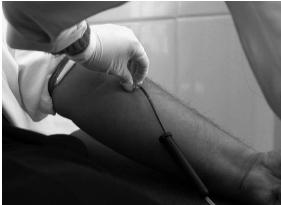
Por cada caso registrado hay entre 25 y 50 no conocidos

La Organización Mundial de la Salud, la máxima autoridad sanitaria en el orbe, calcula que los casos registrados de sida