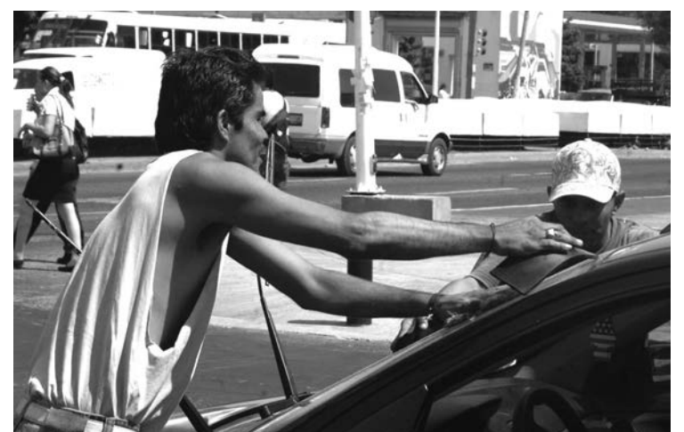
Se quejan de que no les permiten trabajar

Frente a esta situación reiterada y sin prejuzgar sobre la certeza de los hechos, la CEDHJ solicitó las medidas precautorias con el fin de evitar la consumación irreparable de derechos humanos y que se les garanticen sus derechos a la igualdad y al trato digno.