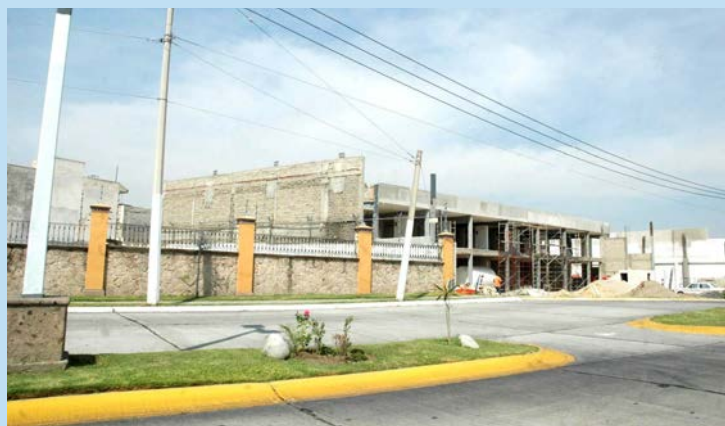
Fraccionamiento Virreyes Residencial

La queja fue interpuesta por vecinos del fraccionamiento por la posible violación de derechos ambientales.