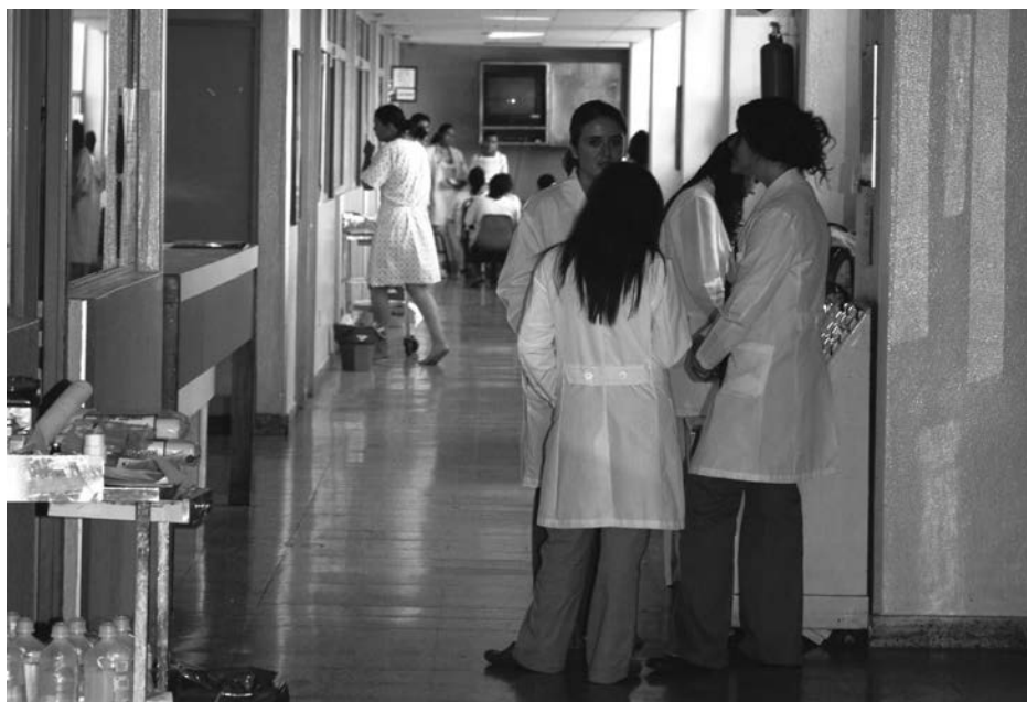
Mucha gente muere en soledad en hospitales