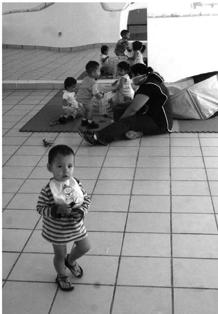
Urge el seguimiento adecuado de su situación jurídica

Al analizar el acta ministerial que después dio inicio a la