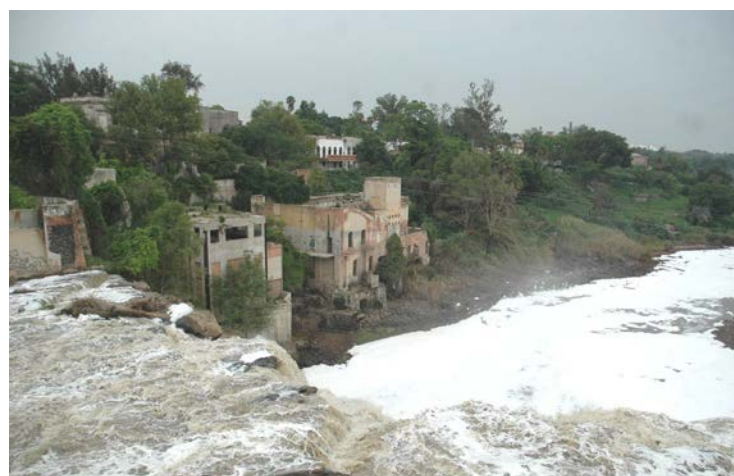
La Recomendación se emitió en enero

Tras una investigación detallada y el análisis de las evidencias, el organismo concluyó que las condiciones actuales de contaminación en el río Santiago, no son sólo responsabilidad de