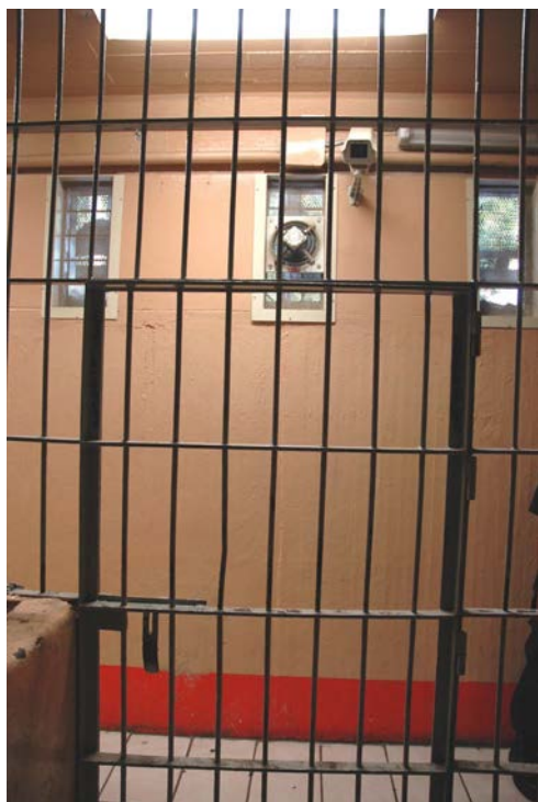
Se pidió la instalación de cámaras

El 18 de marzo de 2008 este organismo recibió una queja a favor de una persona que el 15 de marzo de ese año fue privada de la libertad por policías municipales y posteriormente murió en las celdas.