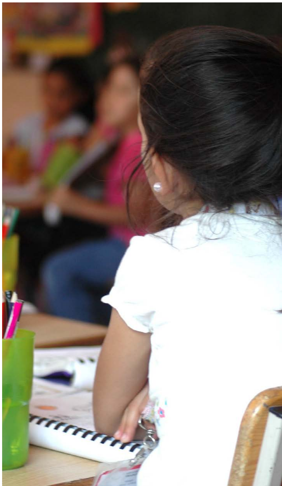
Tres niños fueron separados de su familia

Al Consejo Estatal de Familia le pidió diseñar una base de datos para identificar cuántas niñas y niños se han integrado temporalmente a un albergue