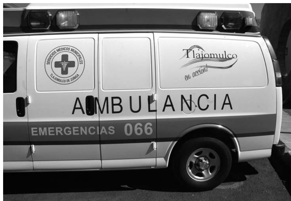
Ineficiente reacción de los servicios médicos

La quejosa amplió su inconformidad en contra de dos médicos de la Cruz Verde de ese municipio porque no atendieron debidamente a su esposo