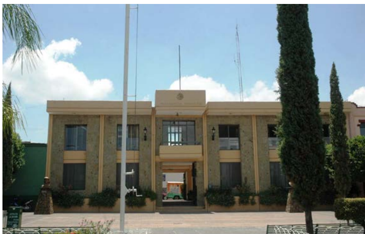
El alcalde deberá reparar daños

Recomendó también que instruya a los jueces municipales para que en lo sucesivo resuelvan la situación jurídica de las personas y dejen constancia de esa actuación.