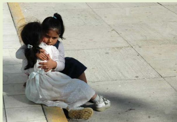
La CEDHJ ve el interés superior de la niñez

los niños, no considera las visitas de familiares, por lo que giró instrucciones al área de trabajo social para realizar el cambio.