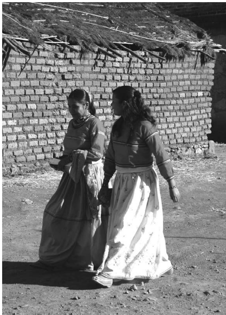
Las mujeres deben recibir atención en su embarazo

Cuando tuvo al recién nacido en sus manos, cortó el cordón umbilical como pudo y salió del centro de salud afectada por su prematura maternidad, su escasa madurez y el trauma del rechazo de su pareja y el temor a ser reprendida por sus padres, a quienes les ocultó el embarazo. En el trayecto entró en unos baños públicos, donde privó de