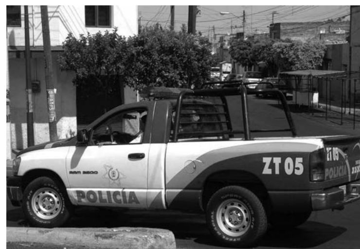
Un hombre fue golpeado por policías de Zapopan

Los hechos documentados en la resolución ocurrieron el