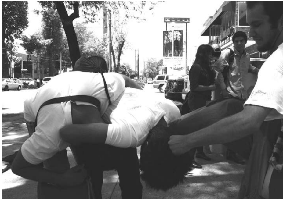
En la mayoría de las secundarias se registra el fenómeno bullying