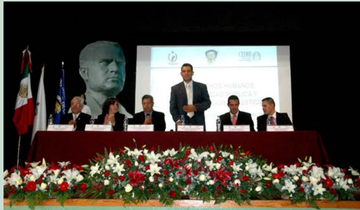
Al evento asistieron diversas autoridades

Destacó la importancia de que en Jalisco se fomente la capacitación sobre las garantías individuales y que su práctica se vuelva una costumbre para que los derechos humanos prevalezcan en un ambiente de respeto y de mutuo reco-