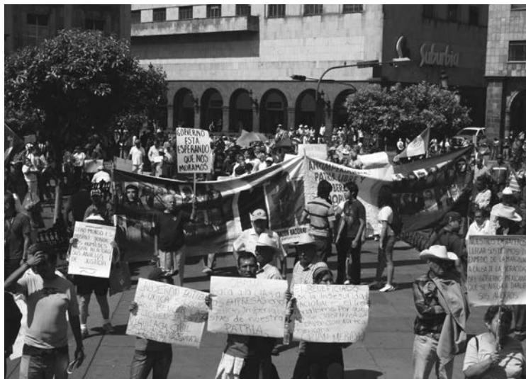
Las manifestaciones están consideradas en la Constitución