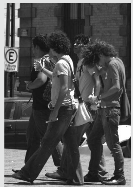
La violencia ha crecido rápidamente

Cierto, resolver este problema no es sólo responsabilidad de la Secretaría de Educación, lo es también de maestros, padres de familia y los propios estudiantes. Un niño que agrede y abusa de otro de sus compañeros de manera sistemática habla de un conflicto de orden personal y familiar.