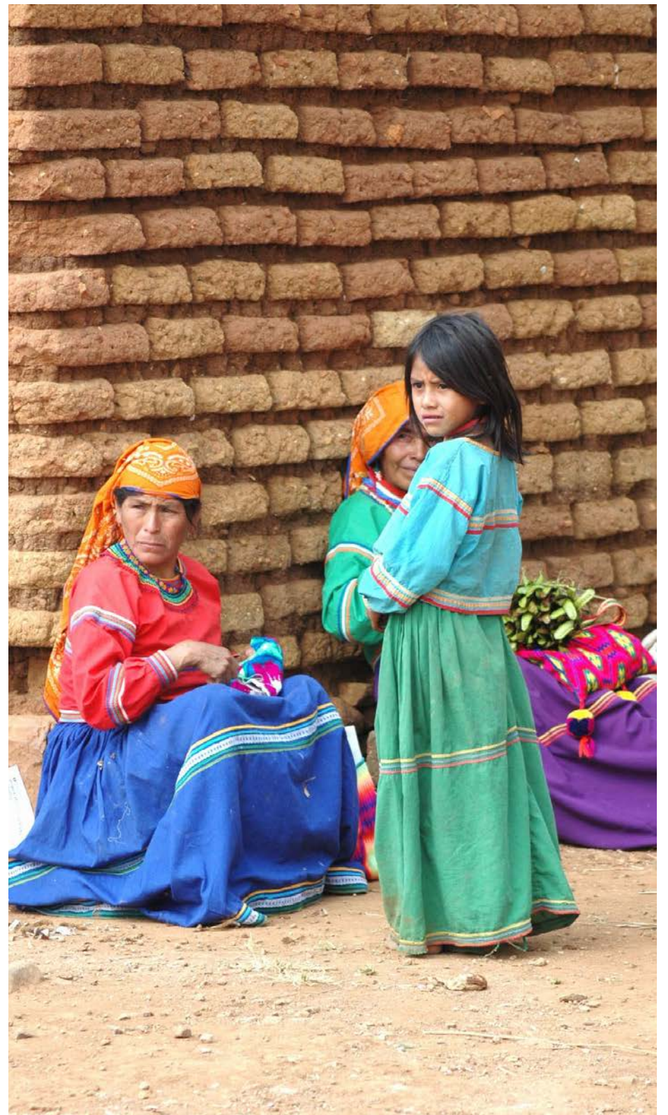
El Estado debe brindar salud a las comunidades indígenas