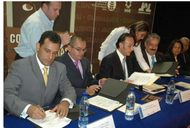
Reunión del Comité Regional

La Comisión urgió a las autoridades para que se registre y se tipifique la trata de personas como delito genérico, porque actualmente está en lo que se refiere a los menores de edad, pero también las mujeres son sometidas a la explotación sexual y laboral.