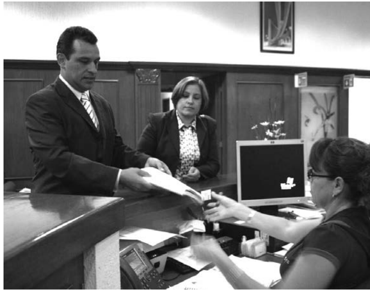
Pondrán en marcha 24 programas de trabajo

Álvarez Cibrián manifestó su convicción de que una de las principales causas de las viola-