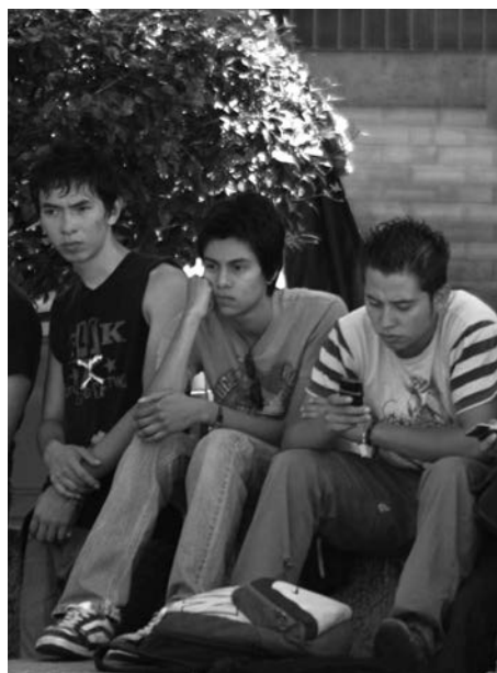
La SEJ ha hecho poco para frenar la

El fenómeno bullying es más que un juego de niños, en la persona agredida puede provocar diferentes reacciones como inseguridad, baja autoestima, mal rendimiento escolar y depresión, entre otras. En el agresor puede reforzar una conducta violenta que podría llevarlo a ser un adulto problemático, inestable e incapaz de adaptarse a su sociedad.