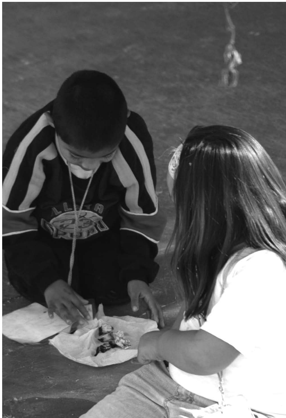
De 2004 a 2006 han ocurrido 207 sustracciones de niños

Aunque convenios internacionales obligan a la República mexicana a considerar