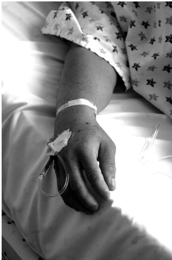
Un mal diagnóstico provocó la muerte de una mujer

En la investigación realizada por la CEDHJ se acreditó que el servidor público que atendió a la joven en el centro de salud Constitución no es médico, sino licenciado en enfermería. Él le determinó una probable fiebre por dengue, y en lugar de canalizar a la paciente ante un médico, se limitó a recetarle paracetamol y amoxicilina, sin tener la prepa-