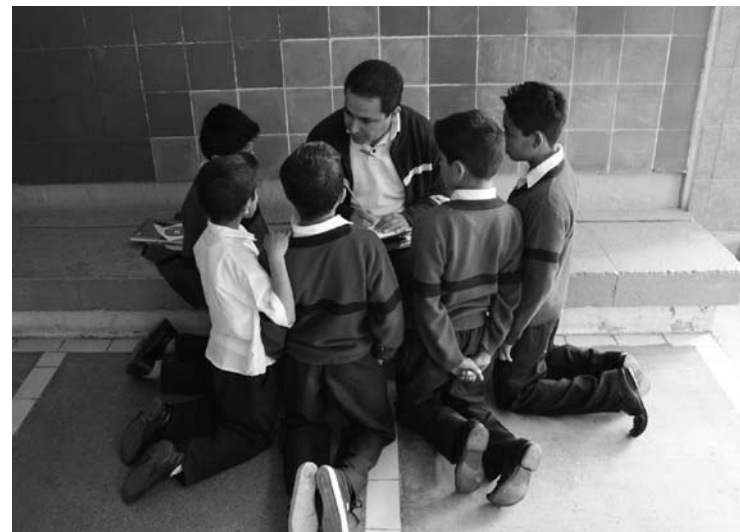
La niñez es vulnerable a violaciones de sus derechos

La CEDHJ inició con un Programa de Supervisión del Respeto de los Derechos Humanos de la Niñez en las Instituciones Responsables de su Cuidado y Custodia en el estado, con el objetivo de impulsar las acciones que garanticen el pleno disfrute de todos sus derechos.