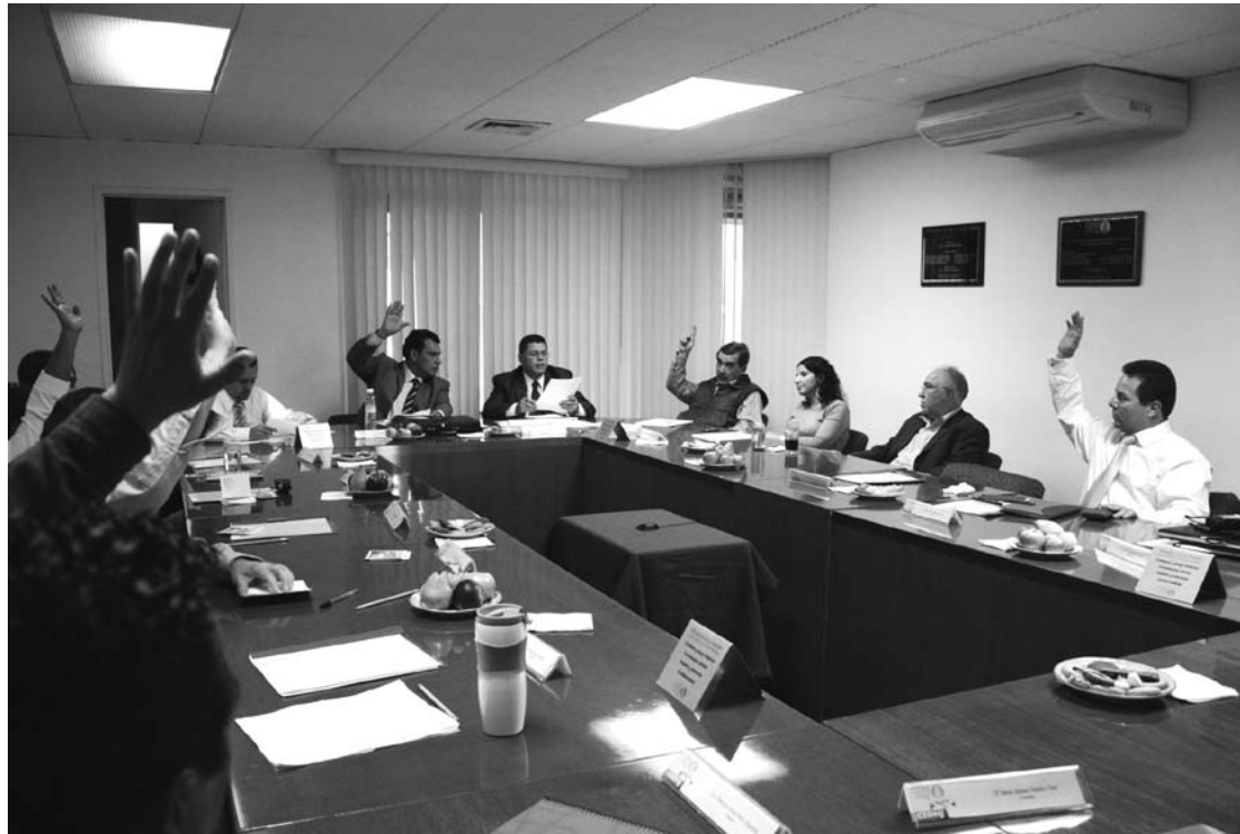
Los nuevos integrantes del Consejo Ciudadano tomaron protesta en noviembre de 2010

DHumanos pidió a los nuevos consejeros que contestaran las siguientes preguntas en relación con los derechos humanos y estas fueron sus respuestas.