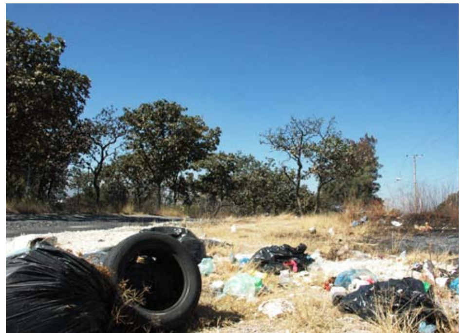
Varias autoridades se reunieron para analizar el daño ecológico