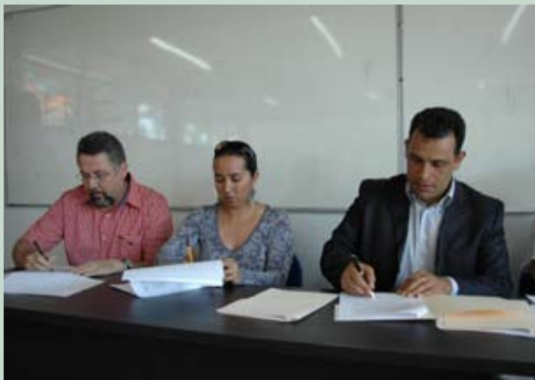
Firma convenios con asociaciones de El Grullo

En El Grullo, durante su gira por la Costa Sur, el ombudsman lamentó que los habitantes de los municipios fuera de la zona metropolitana carezcan de información sobre los derechos