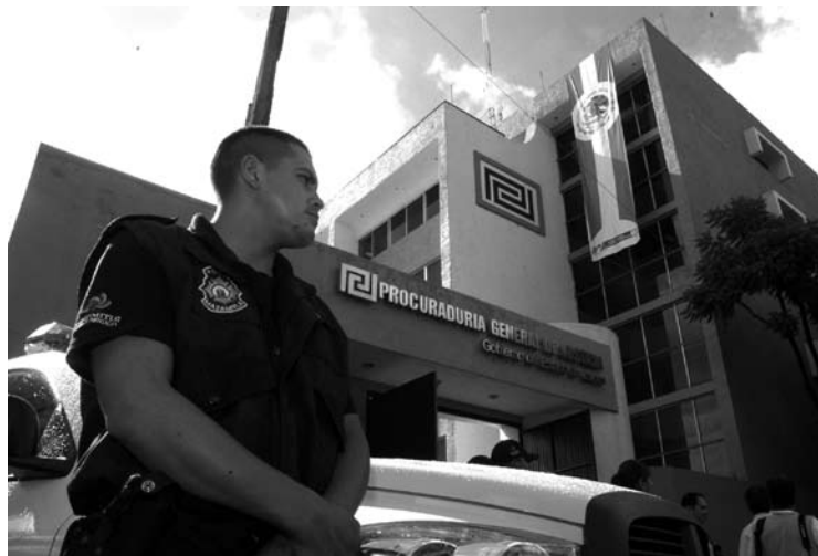
La PGJE deberá investigar a cinco de sus elementos

La CEDHJ acreditó violaciones de los derechos a la privacidad, a la dignidad, a la libertad, a la integridad y seguridad personal, y a la legalidad y seguridad jurídica de mujeres que se dedican al sexoservicio, y solicitó el inicio de una averiguación previa en contra de los servidores públicos citados por el delito de abuso de autoridad, allanamiento de morada, amenazas y golpes simples.