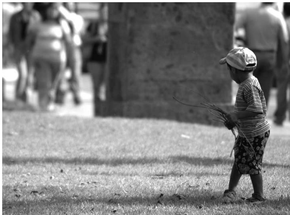
Los niños y niñas tienen derecho a vivir en una familia

* Las verdaderas identidades han sido modificadas, a petición de las mismas personas, en resguardo de su integridad.