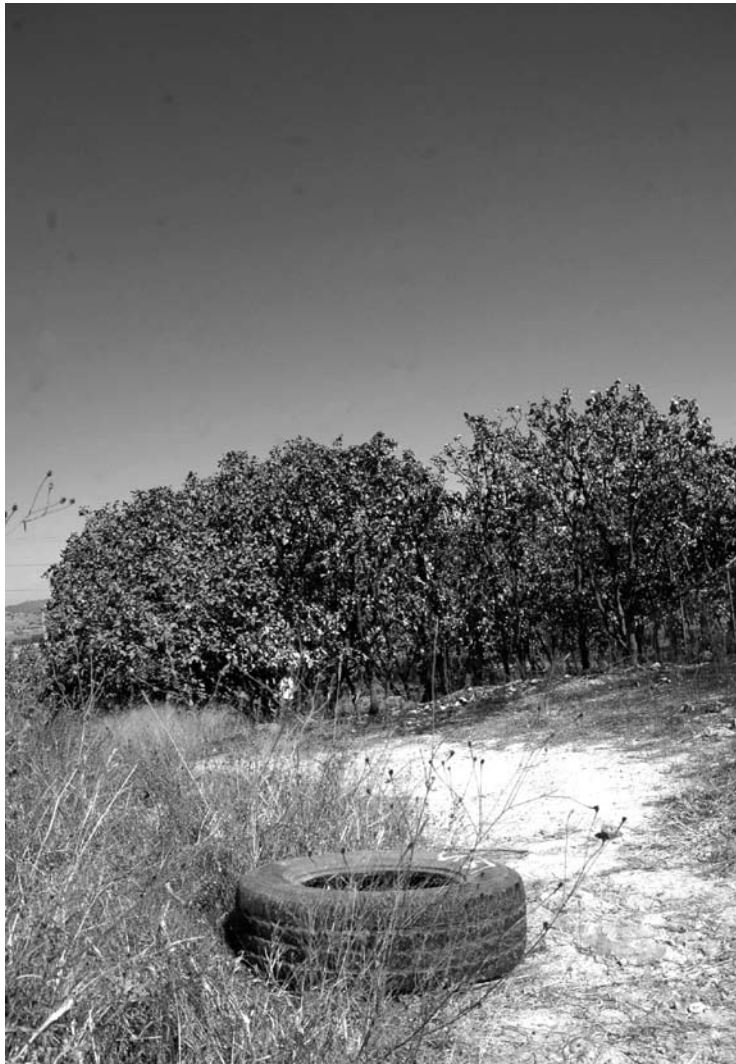
El bosque y los vecinos están expuestos a la contaminación

Los servidores públicos coincidieron en la necesidad de tomar soluciones urgentes y plantearon la posibilidad de exponer