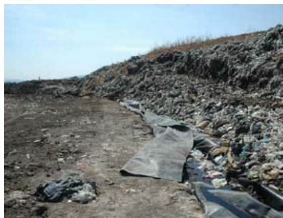
El vertedero contamina los pozos de agua

Le recomendó también destinar recursos para realizar los estudios pertinentes y la construcción de un sistema eficiente y productivo de control de biogás que impida que éste se libere de manera natural.