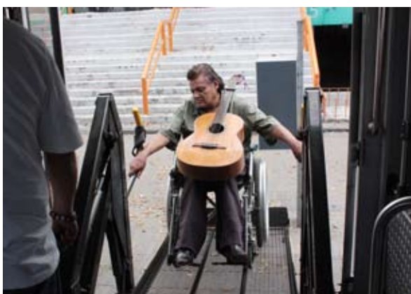
Uno de los objetivos es combatir la desigualdad

Como resultado del Encuentro Regional con Organizaciones de la Sociedad Civil, líderes y representantes de las asociaciones formularon un documento compromiso en el que asumen trabajar en conjunto con el fin de crear conciencia sobre los diferentes