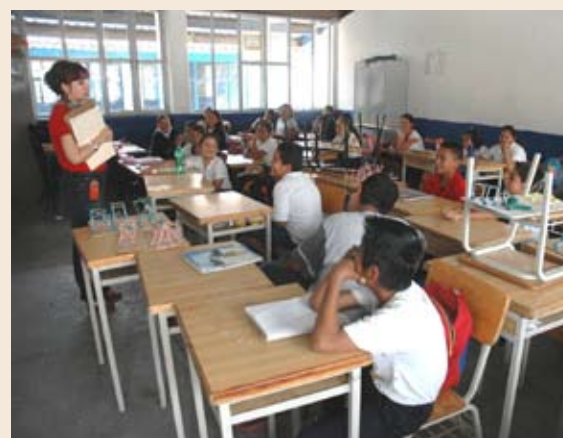
Fueron alrededor de 50 los egresados