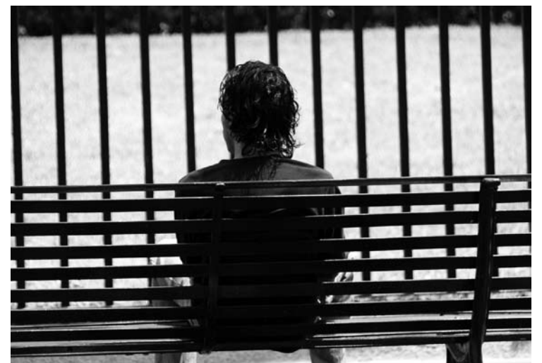
El joven ha tenido tres intervenciones quirúrgicas