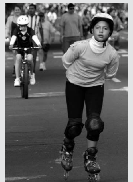
La recreación es un derecho

“Se han de ofrecer oportunidades especiales a los jóvenes, comprendidos los niños de edad preescolar, a las personas de edad y a los deficientes, a fin de hacer posible el desarrollo integral de su personalidad gracias a unas programas de educación física y deporte adaptados a sus necesidades”, dice la carta firmada