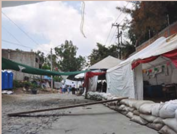
Los habitantes fueron desalojados por policías

El ombudsman dialogó con un grupo de personas, representantes de las 80 familias desalojadas, a quienes les explicó que por impedimento legal, este organismo no es competente para atender quejas por cuestiones jurisdiccionales; sin embargo, anunció que la Comisión atenderá e integrará las quejas que interpongan por un posible abuso de la fuerza pública durante el lanzamiento.