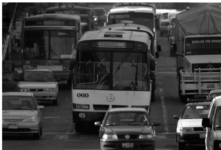
La CEDHJ recibió 2 mil 352 quejas en enero de 2009

Por su parte, el OCOIT y el CEIT informaron que impulsarán la iniciativa de reforma presenta-