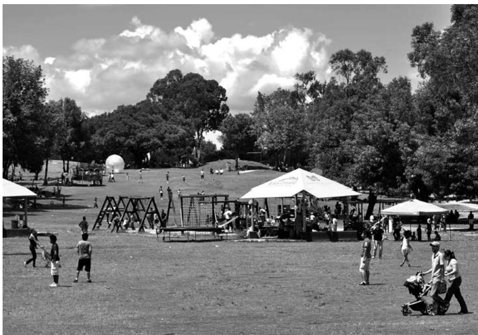
Es necesario promover una política del estado que contribuya al desarrollo

Cuando se le pregunta sobre la situación actual del deporte en el estado se muestra orgullosa de que la selección estatal sea 12 veces campeona en las olimpiadas nacionales, pero está consciente de que la centralización del deporte es un mal que le quita oportunidad de sudar a los municipios