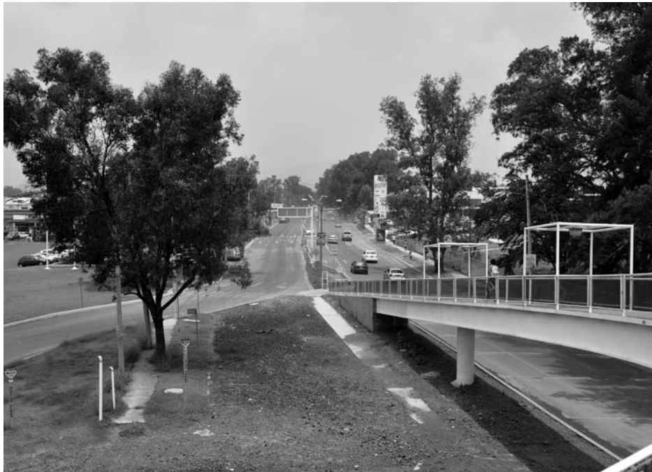
La CEDHJ concluyó que la SVyT no realizó estudios previos al cierre vial

La Comisión Estatal de Derechos Humanos concilió 247 quejas contra los secretarios de Vialidad y Transporte, de Desarrollo Urbano y del Medio Ambiente para el Desarrollo Sustentable del Gobierno del Estado, por considerar que con su actuar violaron derechos humanos a la libertad, al libre paso, así como a la legalidad y seguridad jurídica, al cerrar en julio de 2009 el cruce de Anillo Periférico y camino al ITESO.