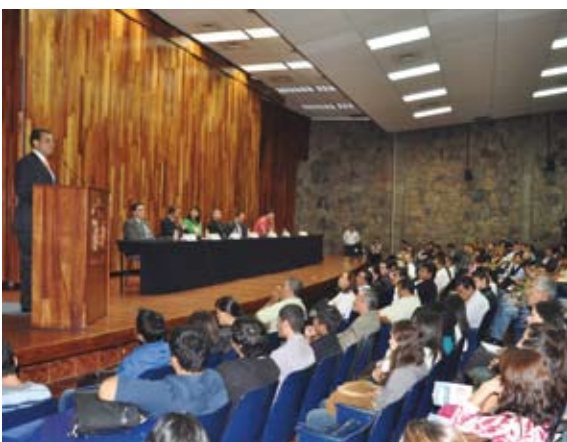
Inauguración del ciclo escolar 2011-B