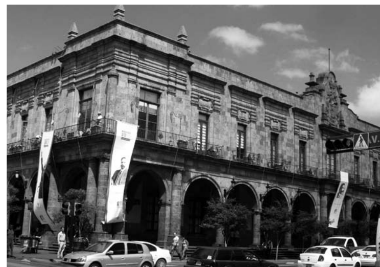
El Ayuntamiento de Guadalajara cumplió la Recomendación

También aceptaron que posteriormente lo trasladaron a la orilla de la barranca de Oblatos y lo empujaron al vacío.