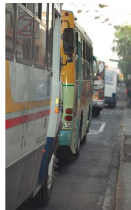
Aceptan autoridades Recomendación